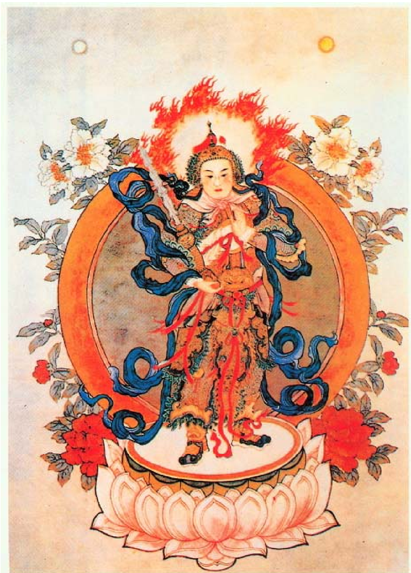
南無護法韋陀菩薩聖像